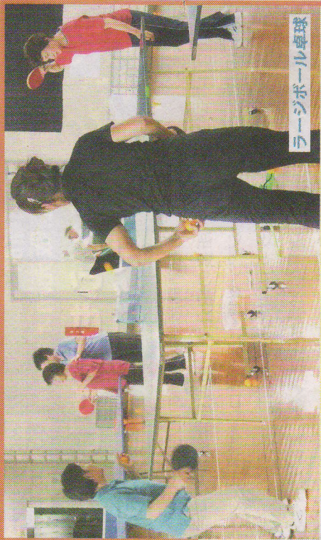
ラージボール卓球