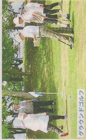
グラウンドゴルフ