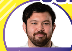
ウルフ アロン さん